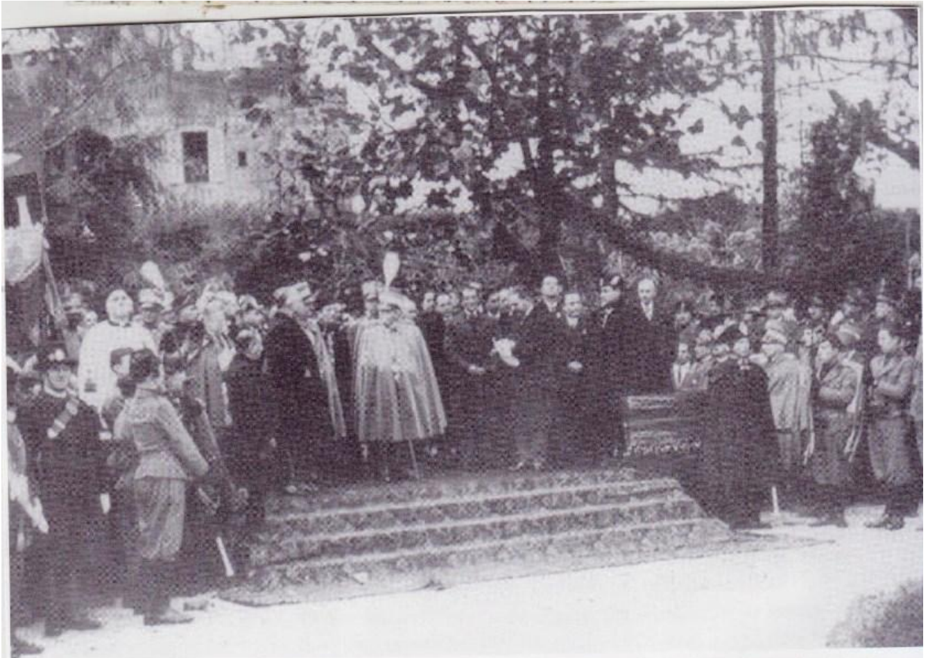
1930 - Cerimonia ufficiale della inaugurazione del Monumento ai Caduti, alla presenza del re, Vittorio Emanuele III.